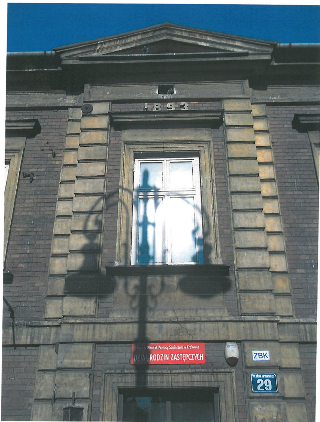
Fot. 10. Kamienica przy ul. Piłsudskiego 29, widok elewacji od strony frontowej. Okno współczesne, nadproże pęknięte. Pęknięcie biegnie od tympanonu.