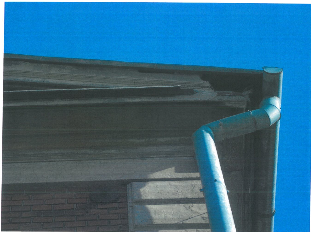
Fot. 14. Kamienica przy ul. Piłsudskiego 29, widok elewacji od strony A. Mickiewicza. Narożnik gzymsu wieńczącego jest całkowicie wykruszony.