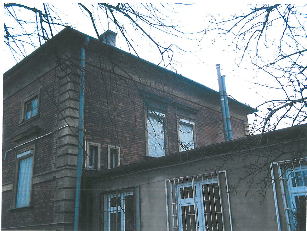
Fot. 4. Kamienica przy ul. Piłsudskiego 29, widok elewacji od strony oficyny. Cegła z widocznymi przebarwieniami, czarną patyną.