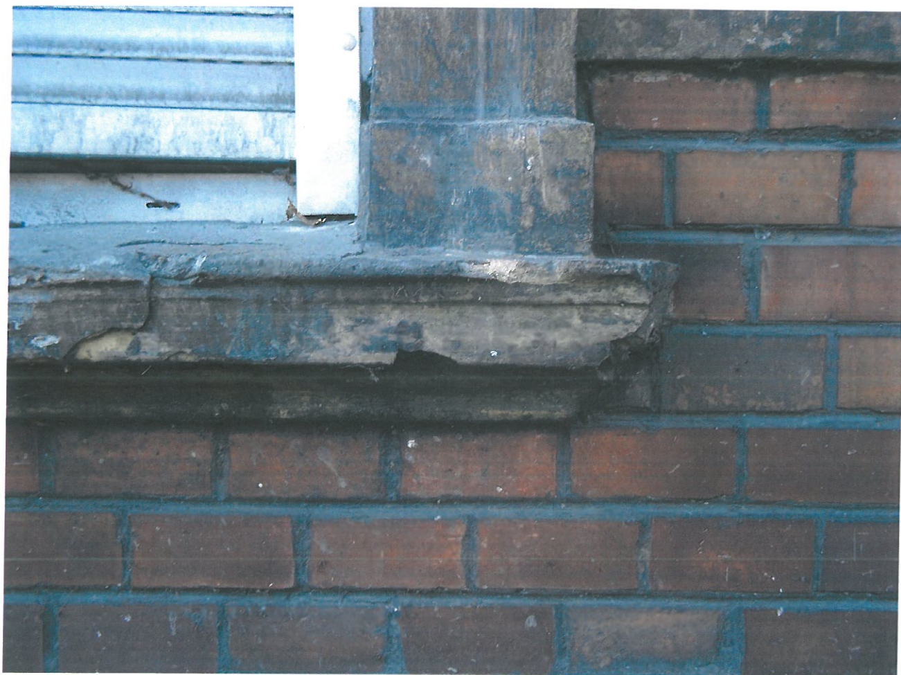
Fot. 12. Kamienica przy ul. Piłsudskiego 29, widok elewacji od strony podwórka. Fragment obramienia okiennego, parapetu. Widoczne duże ubytki, pęknięcia i odspojenia, Fugi i cegła mocno spatynowane.