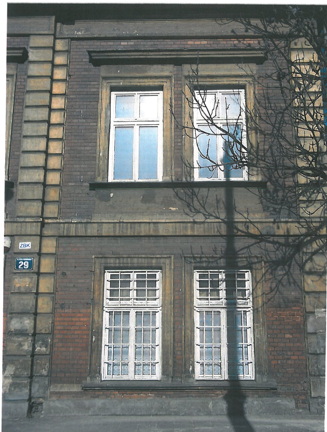
Fot. 9. Kamienica przy ul. Piłsudskiego 29, widok elewacji od strony frontowej.

Okna pierwszej i drugiej kondygnacji w dobrym stanie, (okna nowe w technologii PCV). Należy wymienić je na nowe, drewniane, o podziałach wewnętrznych zgodnych z oryginalnymi. Cegła w dolnej partii elewacji jest zmurszała, miejscami wykruszona. Cała elewacja spatynowana. Obramienia okienne wykruszone, widoczne łąty cementowe.