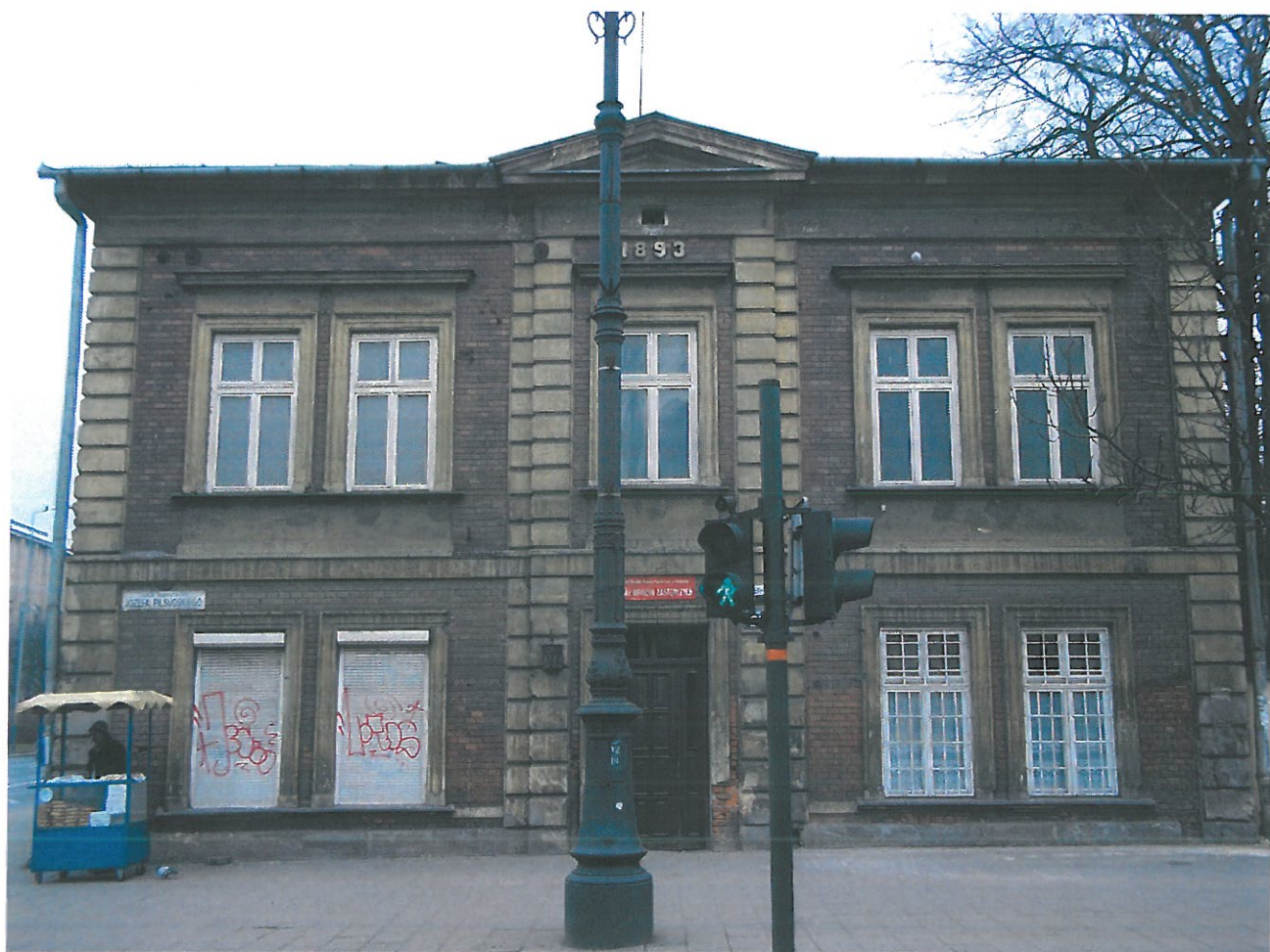
Fot. 1. Kamienica przy ul. Piłsudskiego 29, widok elewacji frontowej. Widoczny ogólny stan zachowania elewacji.