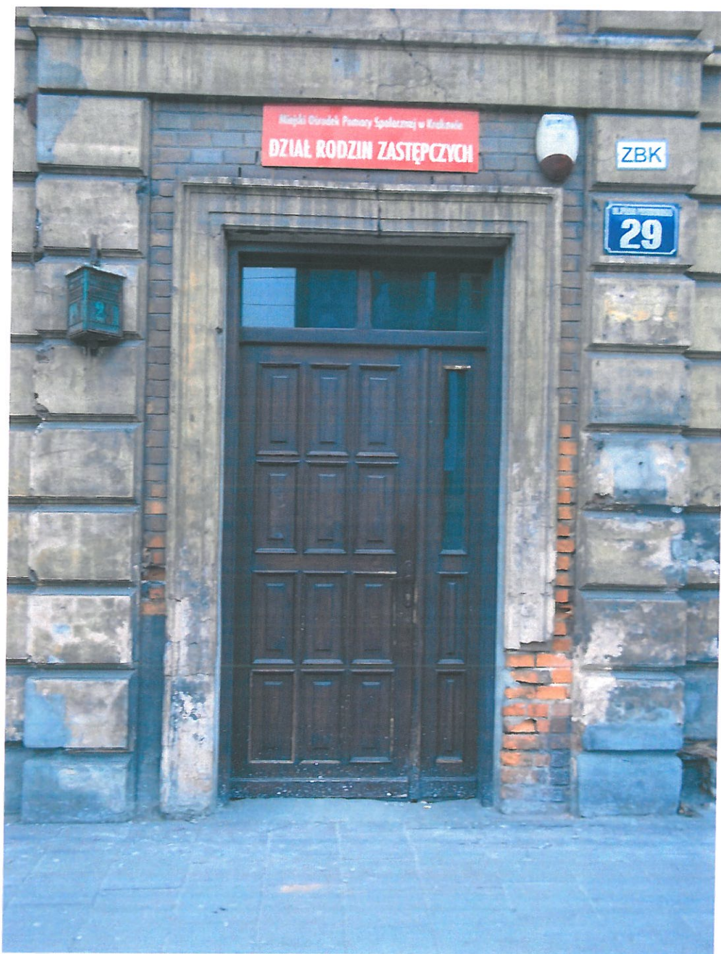
Fot.7. Kamienica przy ul. Piłsudskiego 29, widok elewacji od strony frontowej. Widoczne współczesne drzwi wejściowe do kamienicy. Drzwi frontowe współczesne. Poza framugą i nadświetlem kwalifikują się do wymiany na nowe, korespondujące z charakterem elewacji z końca wieku XIX. Obrazowanie wokół drzwi posiada znaczne ubytki; w dolnej partii odsłonięta cegła jest zmurzała, mocno zabrudzona, z licznymi ubytkami wstęgu. W ryzalicie liczne ubytki w partiach boniowania; dziury, spękania zaprawy, łaty cementowe. Nadproże pęknięte.