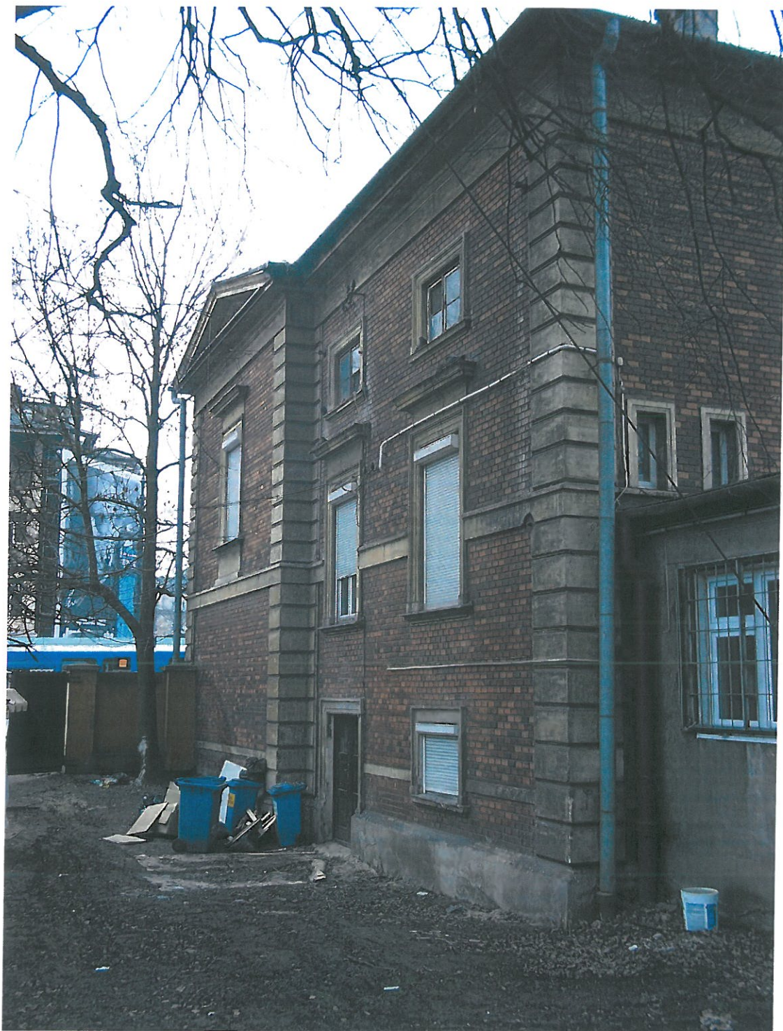
Fot.5. Kamienica przy ul. Piłsudskiego 29, widok elewacji od strony oficyny. Cegła z widocznymi przebarwieniami, czarną patyną. Widoczne ubytki w boniowaniu narożnym, narzuty cementowe w przyziemiu, wykruszenia obramień okiennych, ubytki w gzymsie wieńczącym.