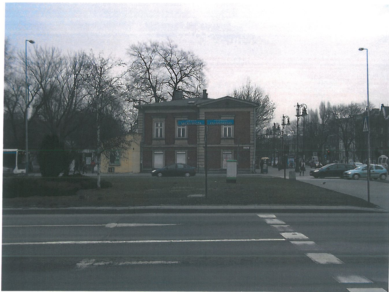
Fot. 2. Kamienica przy ul. Piłsudskiego 29, widok elewacji bocznej, od strony Alei Adama Mickiewicza.