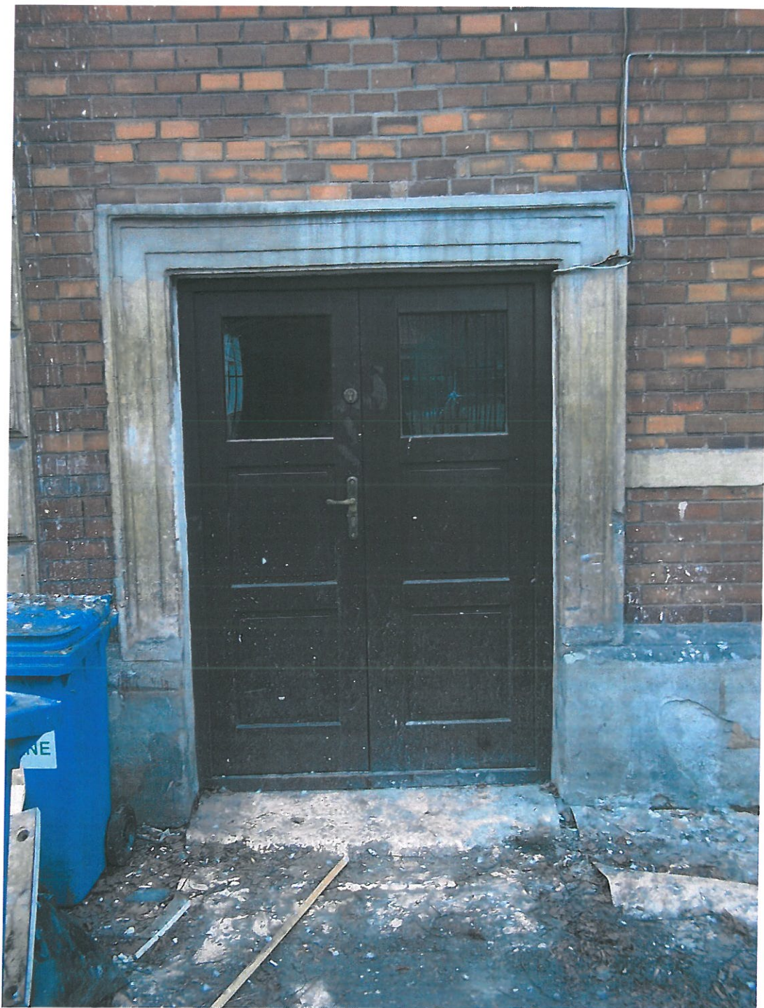
Fot.8. Kamienica przy ul. Piłsudskiego 29, widok elewacji od strony oficyny. Widoczne współczesne drzwi wejściowe do kamienicy. Drzwi kwalifikujące się do wymiany na nowe, drewniane, nawiązujące charakterem do całej kamienicy. Obrazienie drzwi zniszczone, zabrudzone, z widocznymi pęknięciami.

W strefie cokołowej narzuty cementowe – zawilgocone i wykruszone.