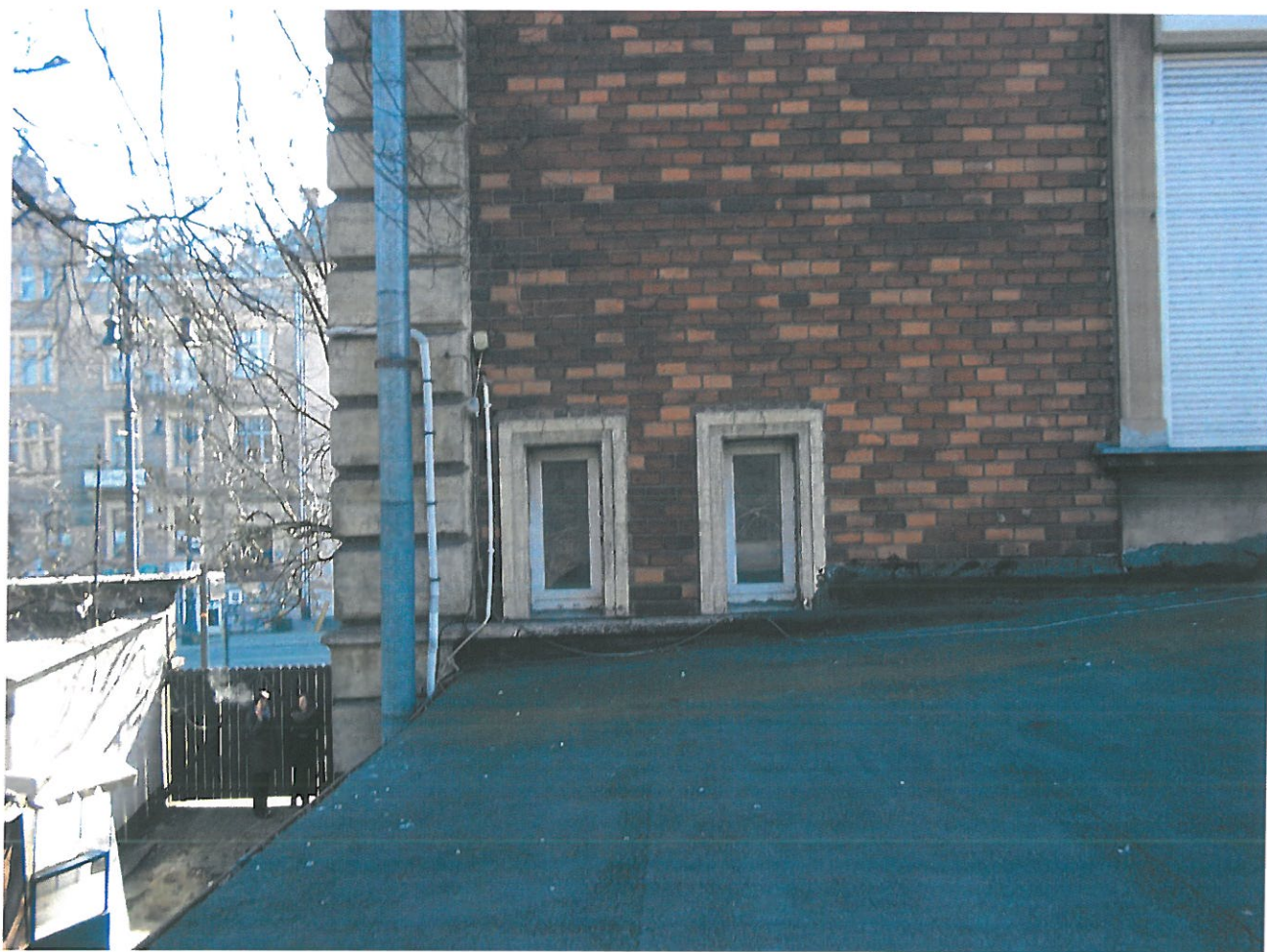
Fot. 15. Kamienica przy ul. Piłsudskiego 29, widok elewacji od strony podwórka. Tylne ściana budynku w obramieniu okiennym dużym widoczny cementowy kit.