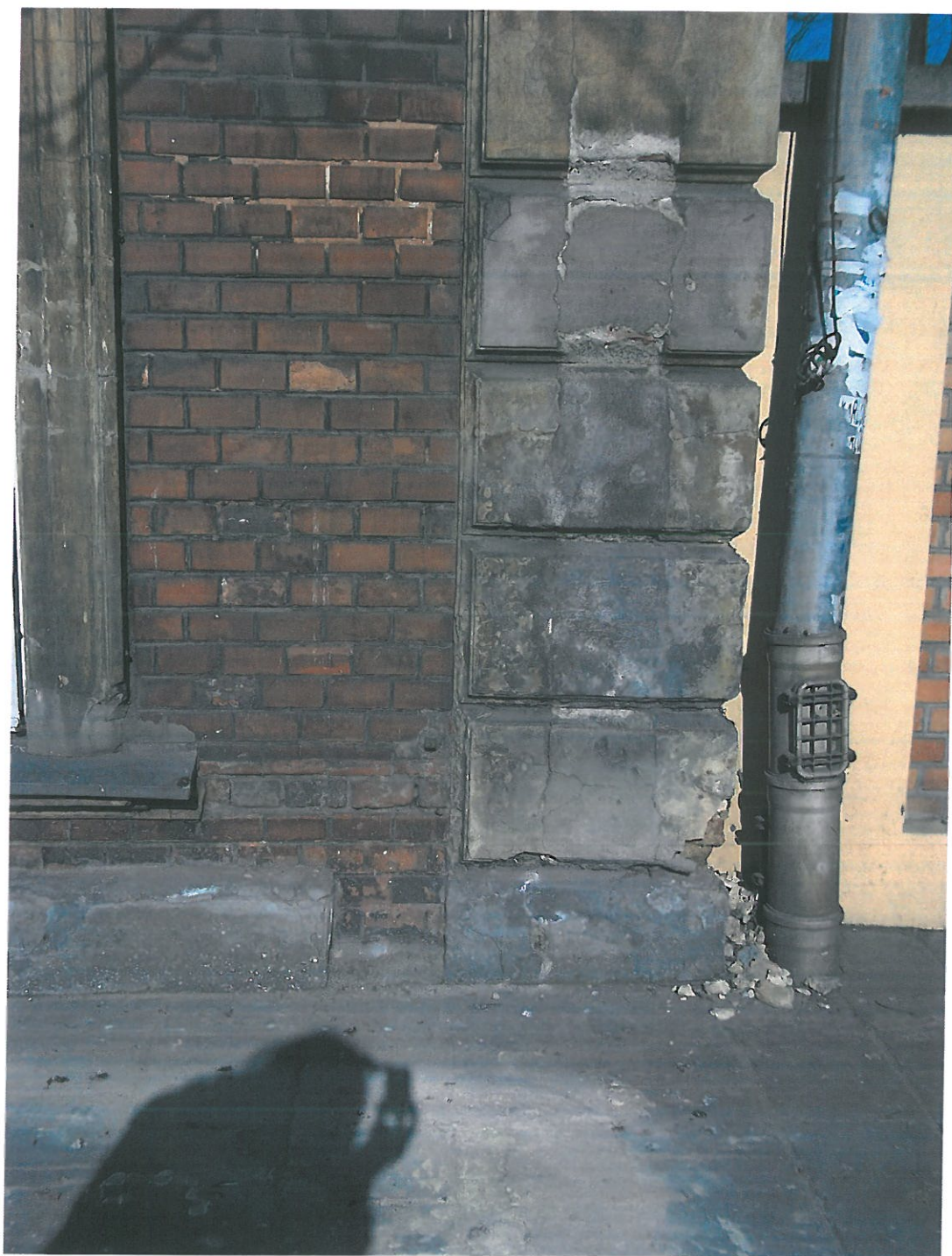
Fot. 11. Kamienica przy ul. Piłsudskiego 29, widok elewacji od strony frontowej. Fragment boniowania w przyziemiu. Wykruszenia, warstwa zaprawy niespójna z podłożem ceglanym, liczne pęknięcia, odsłonięta cegła spod boniowania jest wykruszona.