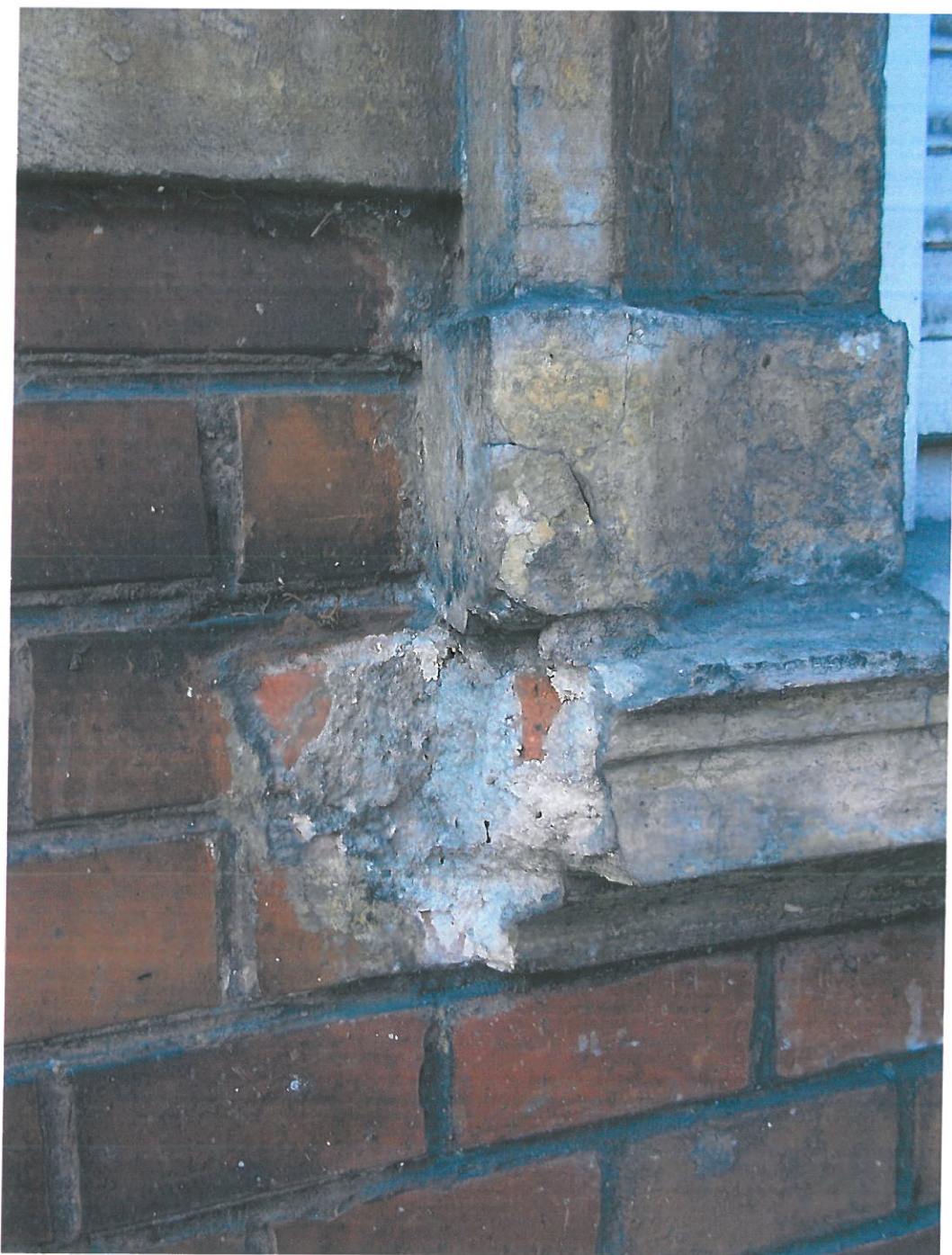
Fot. 13. Kamienica przy ul. Piłsudskiego 29, widok elewacji od strony podwórka. Fragment obramienia okiennego, parapetu. Duży ubytek w dolnym narożu obramienia okiennego. Fugi i cegła mocno spatynowane.