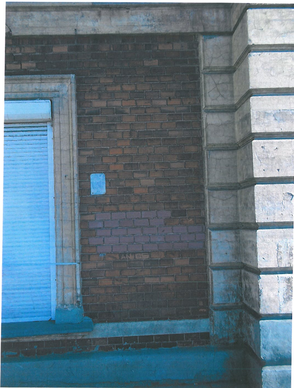
Fot. 3. Kamienica przy ul. Piłsudskiego 29, widok elewacji od strony Alei A. Mickiewicza. Widoczne współczesne przemurowanie.