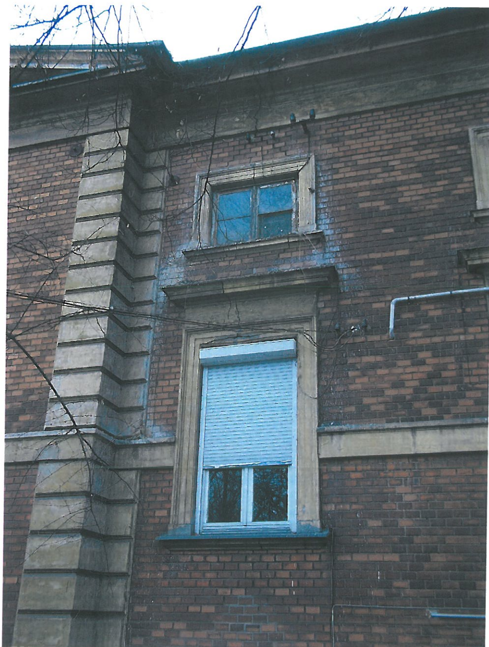
Fot.6. Kamienica przy ul. Piłsudskiego 29, widok elewacji od strony oficyny. U góry widoczne zachowane pierwotne okno drewniane. Obramienia okienne wykruszone, widoczne pęknięcie biegnące przez nadproże okienne. Widoczne kity cementowe w dolnych partiach obramienia okiennego. Cegła spatynowana, na boniowaniu widoczne wykwity glonów i porostów. Ściana zabrudzona ptasim guanem.